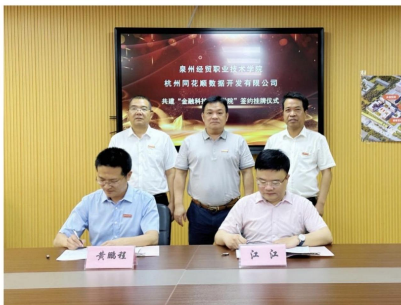
图：产教融合校企共建“金融科技产业学院”

金融科技应用专业学生全面发展，通过课赛结合、课岗对接的模式，培养学生团队协作的能力、创新思维的能力、解决问题的能力等。近三年，组织学生积极参与“一带一路”暨金砖国家技能发展与技术创新大赛、全国大学生金融精英挑战赛、海峡两岸大学生职业技能竞赛等专业竞赛，共获得一等奖 11 项、二等奖 27 项、三等奖 29 项。